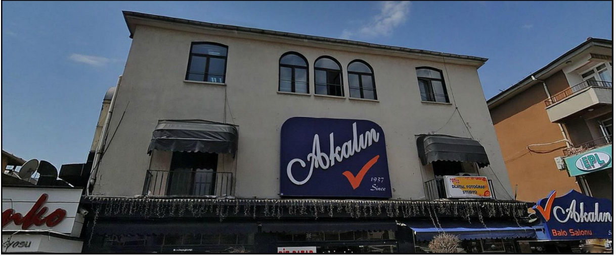
Akalın Pasta Salonu Bahçelievler 7. Cadde (Yıkılmadan önce 2010)