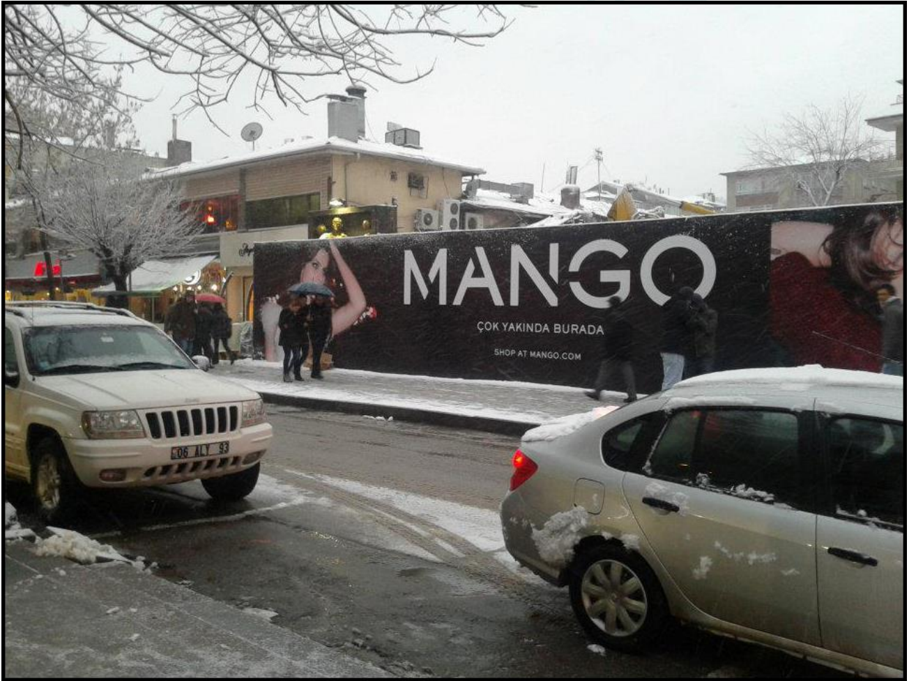
Akalın Pasta Salonu binası yıkıldıktan sonra 2012 (İnşaatın temeli kazılıyor)