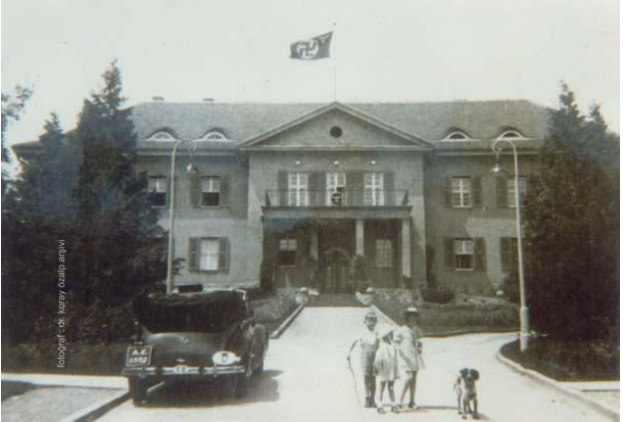
ANKARA - 1942 / ALMAN SEFARETİ

Masmavi gezegende büyük, çok büyük bir savaş çıkmıştı.