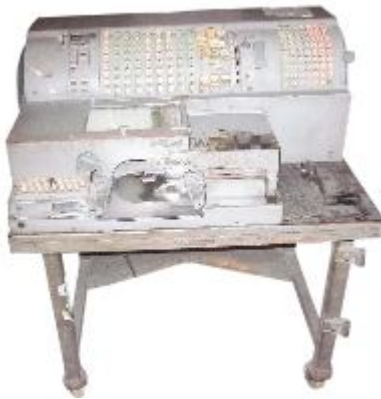
Hesap Cüzdanı-Yazma Makinesi

Paşa Çiftçiler Arasında" adlı tabloları 1928 yapımı. Namık İsmail'in 3 boyutlu "Atatürk"ü ile İbrahim Safi'nin pamuk toplayan kadınları resmettiği "Adana-Sanayileşme"si müzenin görünürdeki diğer tabloları arasında.