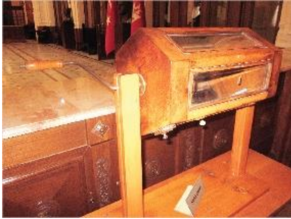
İkramiye çekilişlerinin Kura Çarkı