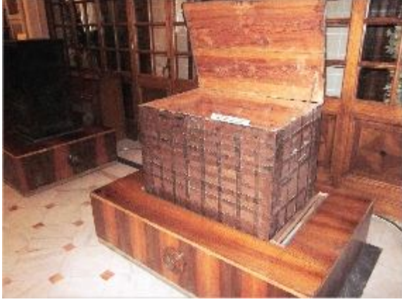
Demir Çemberli Sandık (Bankanın Memleket Sandıkları diye adlandırıldığını anımsayalım