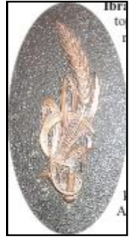
3843 Ziraat Bankası'nın "orak-başaklı" ilk amblemi (Neden değiştirilmiş ola?)

şube-müfettiş mühürleri, hesap ve yazı makineleri, mektup ve altın