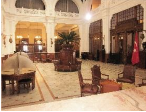
Müzenin genel görünümü

terazileri, şifre makineleri, evrak zarfları, presler, banka cüzdanı ve çek yazma makineleri, para kasaları ve demir çemberli sandıklar, lotarya ve kura (ikramiye ev çekilişleri) çarkları, bazı şube ve reyonların isim levhaları müzede sergilenen gelmekte olan belge ve nesnelere arasında.