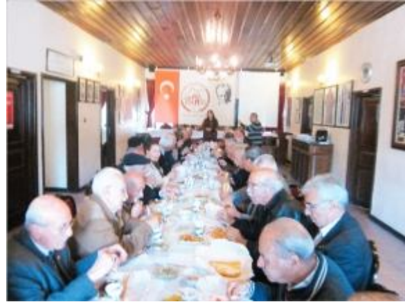
Ferfene'nin yemek ve söyleşme bölümü