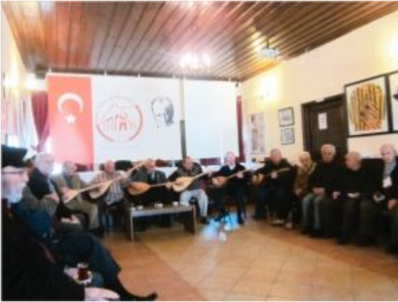
3644 Ferfene'nin saz-söz bölümü