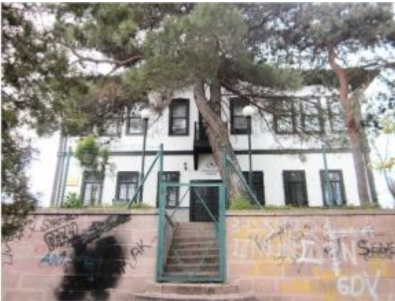
Abidinpaşa Köşkü'nün park tarafından görünüşü

Abidin Paşa'nın 1885-1894 yılları arasındaki valiliği sırasında yaptırılıp, onun adıyla anılan "köşk" Ankara'nın, Osmanlı'nın son zamanlarından bugünlere gelebilen ender sivil mimari örneklerindedir. Kurtuluş Savaşı'na 1.7.1920'den itibaren "Zabit Namzetleri Karargâhı (Harp Okulu)" olarak hizmet veren bina, son olarak 14.4.2012'den bu yana Ankara Kulübü Derneği'nce "Ankara Kültür ve Sanatevi" olarak kullanılmaktadır.