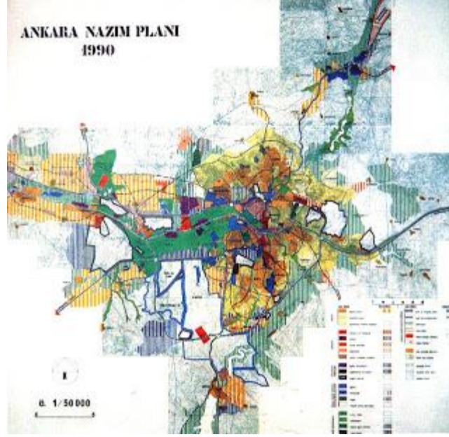
Ankara Metropolitan Alan Nazım Planı 1990 (AMANP Bürosu)

Ankara kentinin coğrafik mekanda yayılımı aşağıda belirlenen alanların jeomorfolojik özellikleri bakımından değerlendirilmesi yapıldığında, kentin yayılımının genellikle yerleşilebilir alanlar üzerinde olduğu ama gecekondular alanlarında olduğu gibi yerleşmeye elverişli olmayan alanlarda da yapılaşmanın gerçekleştiği görülmektedir. Ankara kent formu üzerinde doğal koşulların düzeltici etkileri olmakla birlikte, kent formunun esas belirleyicisinin toplumsal ve ekonomik süreçler olduğu ortaya çıkmaktadır.