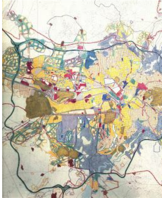
PLAN 3 : ANKARA KENTİ 2020 NAZİM PLAN MAKROFORMU

Kentin batı koridorundaki gelişmesi İstanbul Yolu ve Eskişehir Yolu Aksları boyunca hızla devam etmektedir. Bu koridor üzerinde büyük toplu konut ve yeni yerleşim alanları (Çayyolu, Konutkent, MESA Koru Sitesi, Beysukent vb.) inşa halindedir. Aynı zamanda plan kararları ile önerilen sanayi ve küçük sanatlar gibi iş yerlerinin gelişimi de sürmektedir. Ancak, 1990 planının kabullerine göre Batı Koridoru’nda gerçekleşmekte olan iş yerleri ve konut alanları bu gelişmelerin çoğunlukla alt orta ve sınırlı düzeyde orta sınıflara yönelmesi söz konusudur. Gelişme eğilimleri ve Batı Koridoru’nda yer seçen konut ve iş alanları 1990 plan kararlarını dođrulamaktadır. Ancak, kentin Batı Koridorunda alt ve alt-orta gelir gruplarının dışında diđer üst gelirli (orta ve sınırlı ölçüde üst gelirli) yer seçmediğinden, kentin bu günkü yapısında da var olan kuzey ve güneyi arasındaki sosyal kesiklikler pekişerek devam edecektir. Bu durumda Ulus’tan batıya uzanan yeni merkez gelişiminin dinamiği de yavaşlayacaktır. (UTKM, Proje Yarışması, I. Ödül Plan Raporu) 1990 Nazım Plan’ının politikası, mevcut ve yeni alt merkezlerin güçlendirilmesini, günlük alış-verişin metropoliten merkezin dışına kaydırılmasını ve ana merkezin yönetsel, kültürel ve olağanüstü ticaret etkinliklerinde uzmanlaşmasını öngörmektedir.